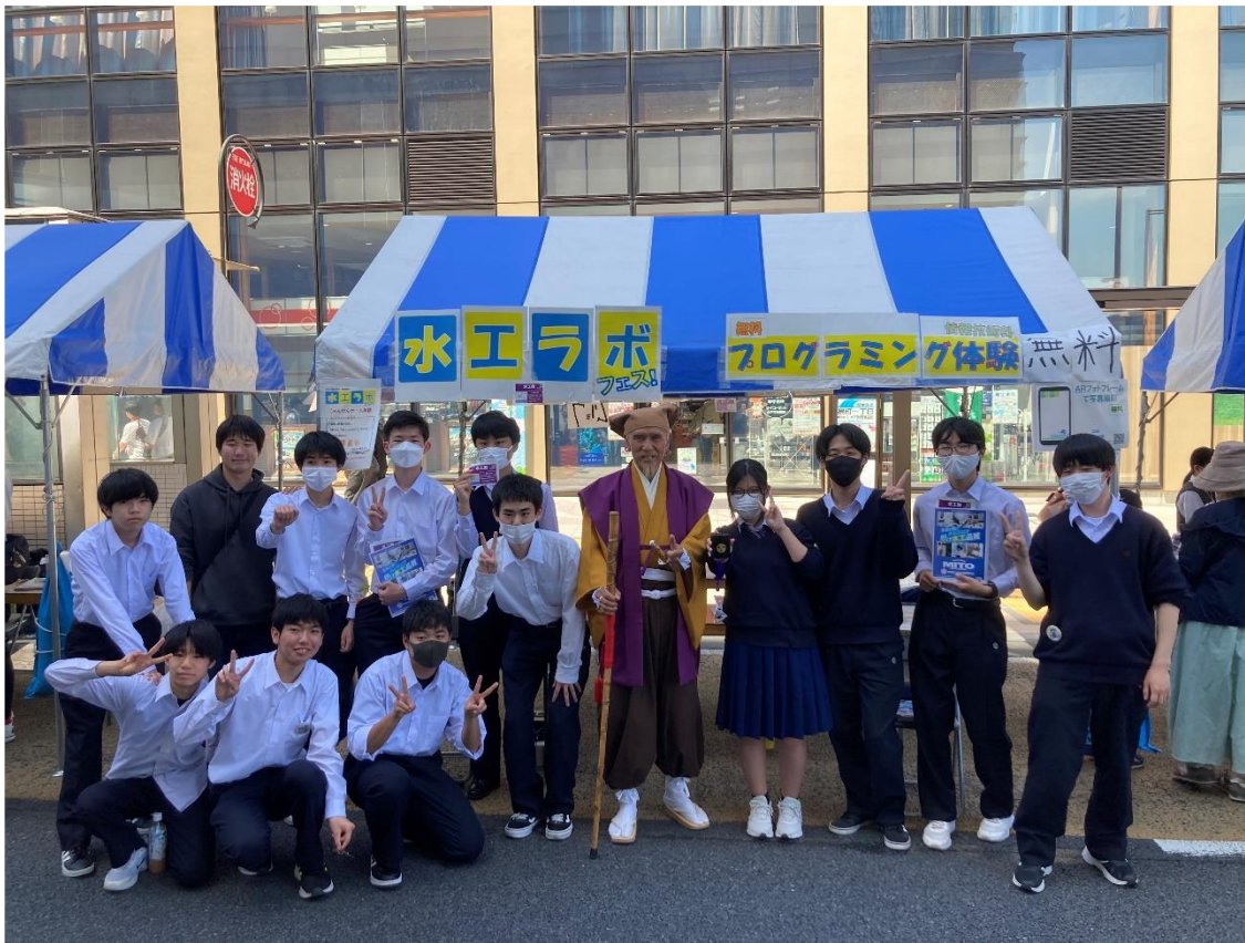
黄門様(水戸光圀公)*との写真撮影