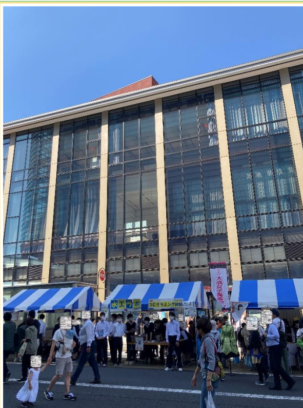
市民会館前でのブース運営

※(一社)水戸葵社中 https://www.mito-aoi-shachu.com/ により掲載許諾