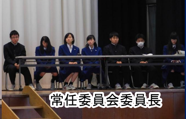
常任委員会委員長