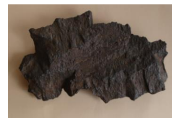
艦砲射撃砲の破片