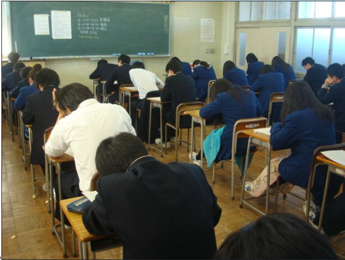
↑ 考査風景 (建3)

というのも、皆さんが社会に一步出たら、期限を守らないということは、信用を失くすということに繋がりがねないからです。人の信頼を失うことは、社会人としてはとても損害が大きいです。誰にも迷惑かけていないとか、面倒くさい、とかの言い訳は通用しないのです。提出物を催促されている生徒は、反省してください。